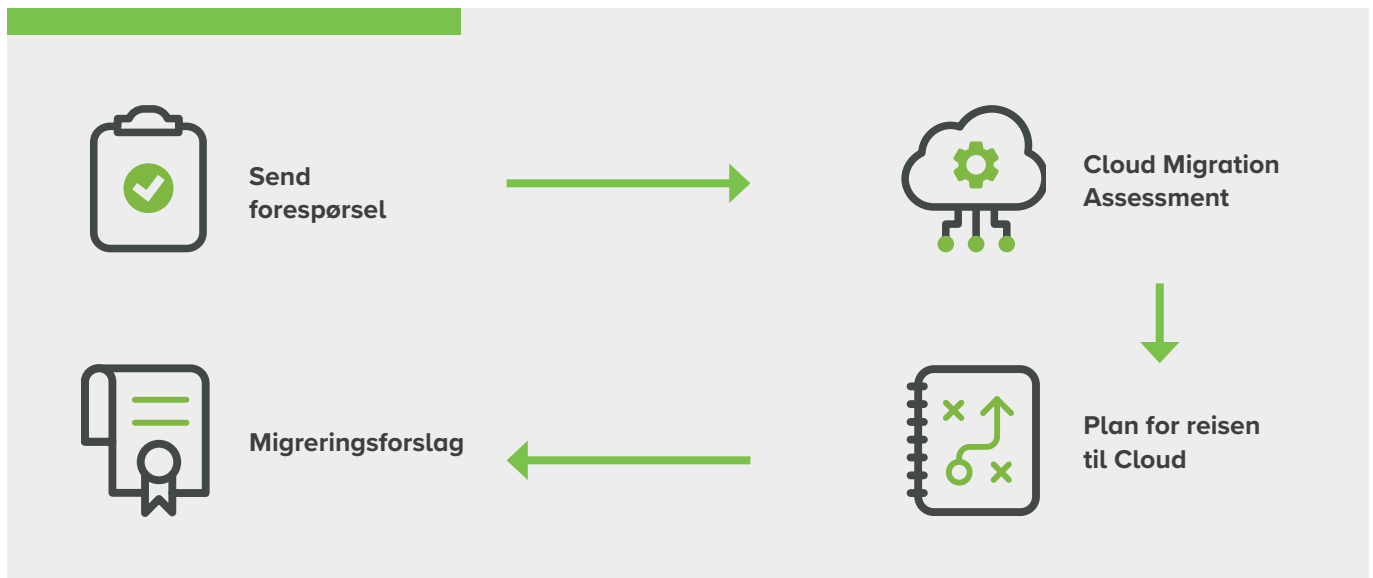
Figur 1: Cloud Migration Assessment

Planen omfatter en onboarding-plan med og klare tidsrammer og ansvarsområder for hele migreringsprosessen, inkludert eventuelle nødvendige systemoppdateringer.